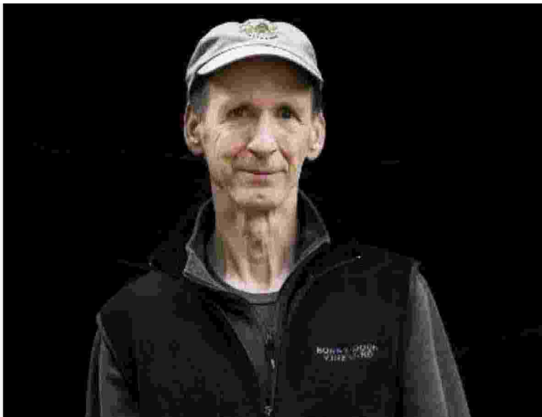
L'americano James Clifford è uno dei più autorevoli antropologi contemporanei

La prima: da quest'anno alcuni degli eventi si svolgeranno anche a Pescia. La seconda: il festival si fa più forte, beneficiando per la prima volta dei contributi di Intesa San Paolo e di Regione Toscana. Tra i nomi degli ospiti alcuni dei più illustri studiosi italiani, come Maurizio Bettini, e un super relatore in arrivo dagli Stati Uniti, James Clifford (28 maggio), tra i più autorevoli antropologi al mondo, assieme a quelli più vicini al grande pubblico come Roberto Saviano (28 maggio ore 18.30), la 'militante gentile' Dacia Maraini (28 maggio ore 21.30) alla quale va il Premio Internazionale 2022 dei Dia-